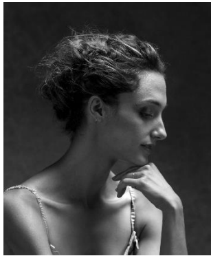
圖二十：巴黎歌劇院舞星多蘿菲·吉爾伯特