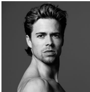
圖二十三：巴伐利亞國家芭蕾舞團客席首席芭蕾舞員、英國皇家芭蕾舞團及荷蘭國家芭蕾舞團前首席舞蹈員馬修·高頓