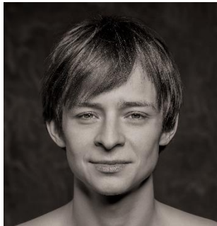
圖二十一：美國芭蕾舞劇院及柏林國家芭蕾舞團首席舞蹈員丹尼爾·善健