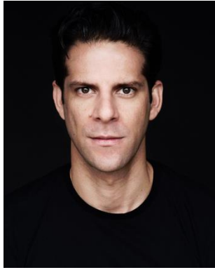
圖十九：國際芭蕾舞星、美國芭蕾舞劇院前首席舞蹈員馬塞洛·戈麥斯