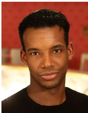
圖十八：巴伐利亞國家芭蕾舞團首席舞蹈員奧賽爾·格雷米奧