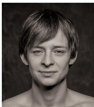
丹尼爾·善健 美國芭蕾舞劇院及柏林國家芭蕾舞團首席舞蹈員

她曾榮獲 2002 年巴黎歌劇院發展協會公眾獎、2004 年塞爾克萊·卡波獎、2006 年芭蕾舞 2000 大獎、2006 年萊奧尼德·馬辛獎、2014 年法國文化部頒發的藝術及文學騎士勳章及 2018 年巴西美景市 FESTiFRANCE 最佳女演員獎。