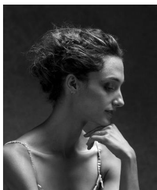
多蘿菲·吉爾伯特 巴黎歌劇院舞星

戈麥斯曾演出所有古典芭蕾舞劇，並出演巴蘭欽、都鐸、麥美倫、泰勒、季利安、杜亞陶及羅曼斯基等知名編舞家作品的重要或為他特設的角色。他又曾為世界多個知名芭蕾舞客席演出。他獲得的殊榮包括 1996 年洛桑國際芭蕾舞大賽「希望大獎」、2008 年貝諾瓦舞蹈大獎，以及 2016 年《舞蹈雜誌》年度舞蹈員等。